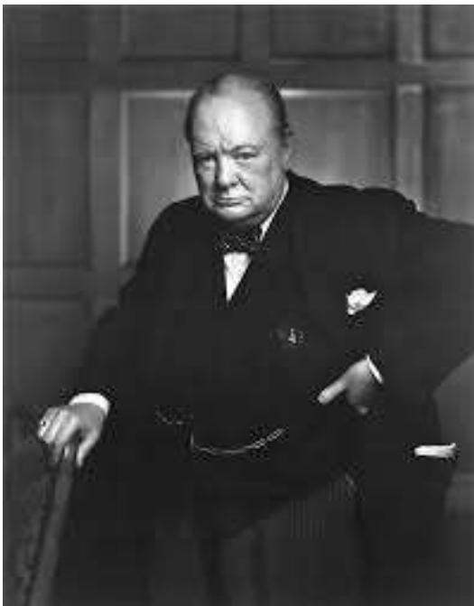
Figura 3. Winston Churchill. https://es.wikipedia.org/wiki/Winston_Churchill