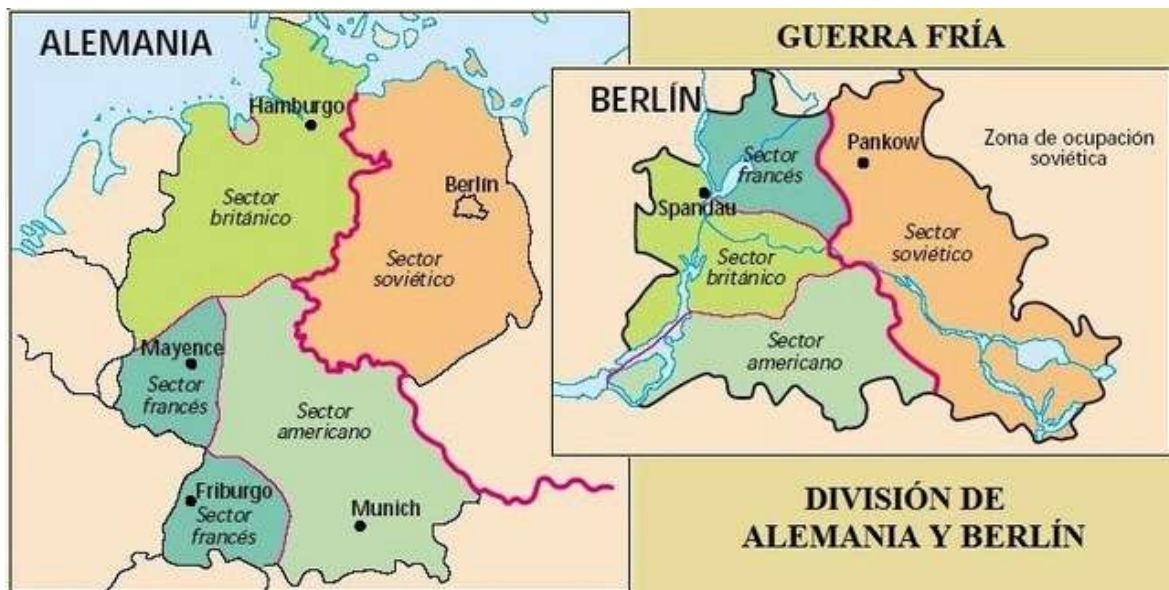
Figura 5. División de Alemania y Berlín. http://fdra-historia.blogspot.com/2017/11/sgm-el-protocolo-de-londres.html