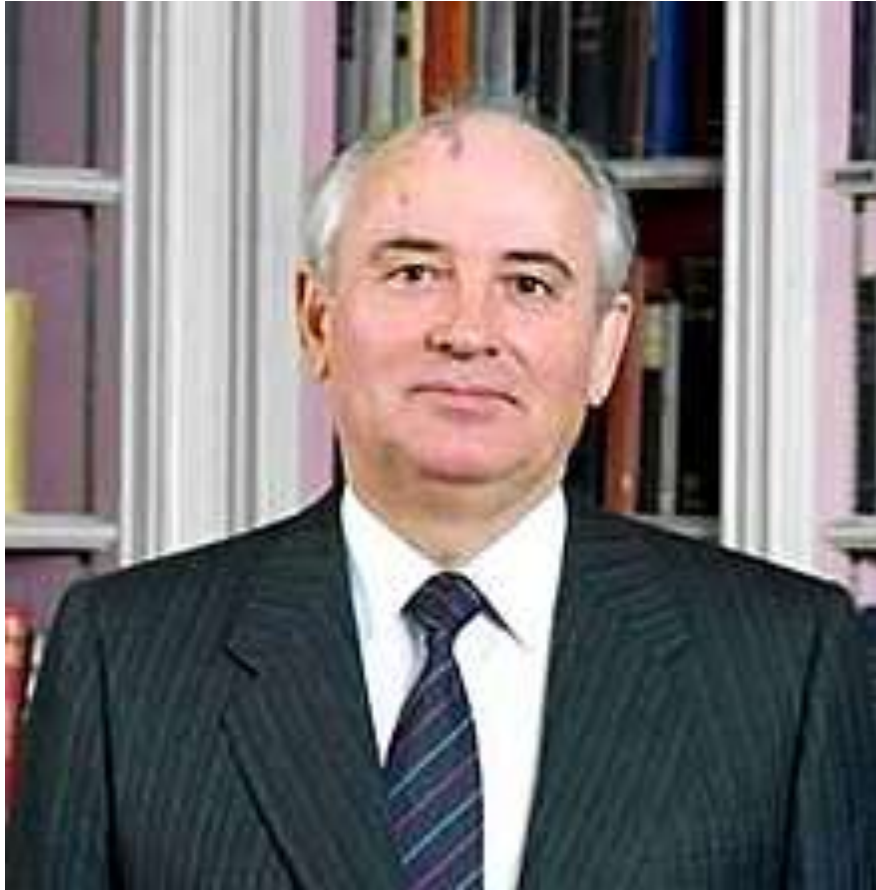
Figura 8. Mijaíl Gorbachov. https://es.wikipedia.org/wiki/Mija%C3%ADL_Gorbachov , 1987, Courtesy Reagan Library, PD