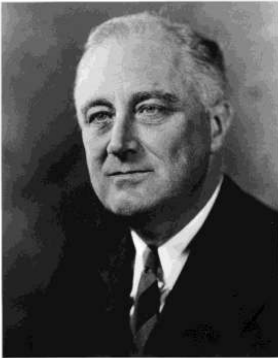
Figura 1. Franklin D. Roosevelt. https://www.kienyke.com/kienfue/franklin-d-roosevelt