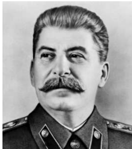
Figura 4. Iósif Stalin. http://perzival.blogspot.com/2015/11/bunuel-stalin-y-los-manifiestos-dada.html