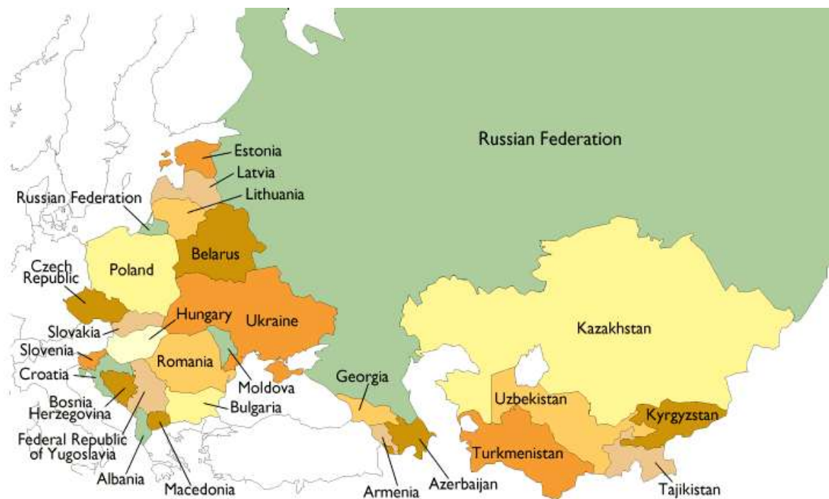
Figura 6. Desintegración de la URSS. http://blogandregzg.blogspot.com/2015/05/paises-surgidos-de-la-desintegracion-de.html