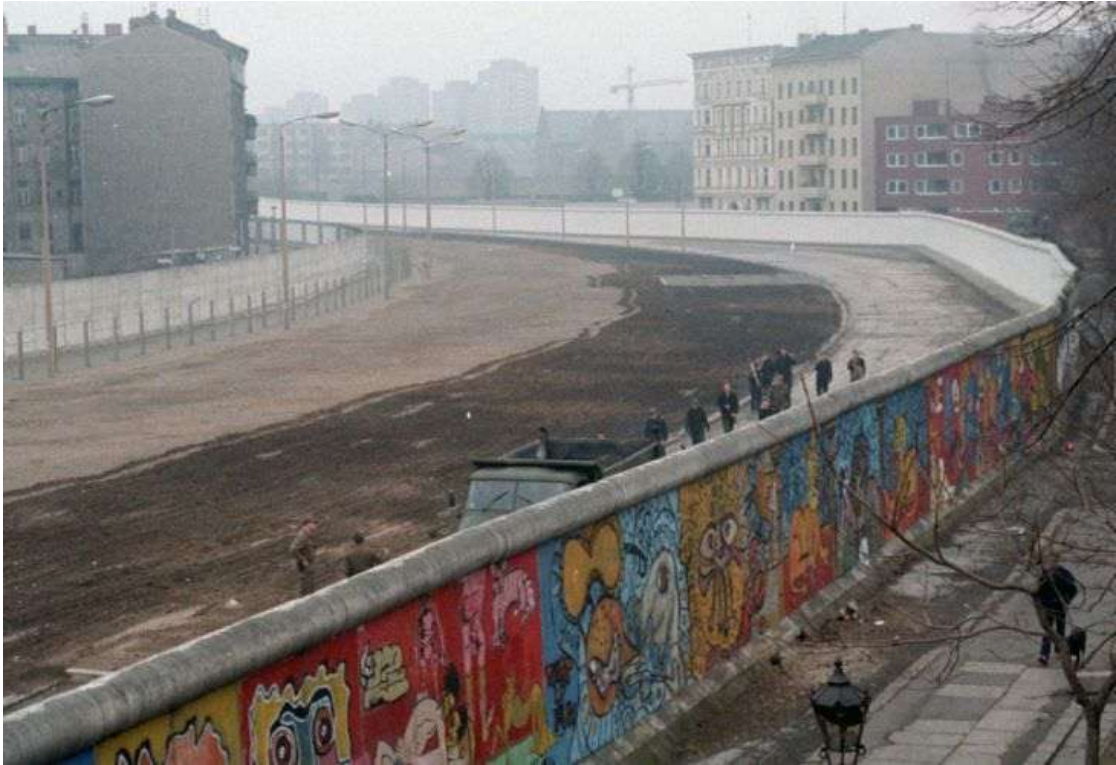
Figura 7. Muro de Berlín. https://www.perfil.com/noticias/cultura/una-cortina-de-hierro-que-dividio-al-mundo-como-era-el-muro-de-berlin.phtml#lg=1&slide=0