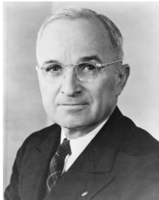
Figura 2. Harry S. Truman .https://www.britannica.com/biography/Harry-S-Truman