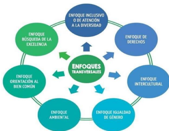
Figura 2 Enfoques transversales.

A continuación, presentaremos los siete enfoques transversales que el Ministerio de Educación considera que el alumno debe ser capaz de desarrollar al finalizar todo el ciclo de formación educativa, así mismo extraeremos tres enfoques que el teatro puede desarrollarlos a través de sus técnicas y herramientas teatrales.