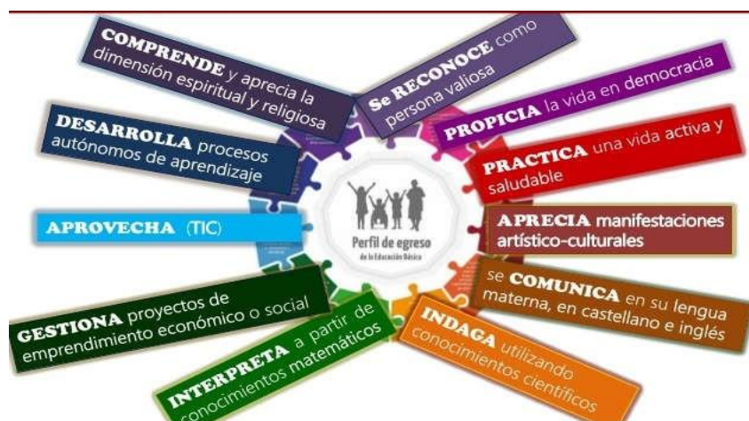
Figura 1 Perfil de egreso de los estudiantes.

manera, los estudiantes estarán supervisados por cualquier docente. En el siguiente cuadro se resume el perfil del egresado.